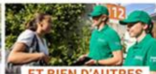
ET BIEN D'AUTRES MISSIONS